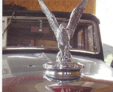
Der Alois „Silver Eagle“, Baujahr 1936, gehört zu den Schmuckstücken der „Kamps Classics“.